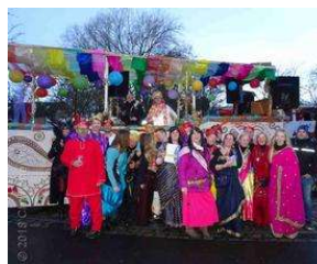
Bergedorferin freut sich königlich beim Marneval von Charlene Wolff